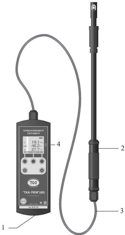
Рис.1 – Внешний вид прибора “TKA-ПКМ”(60)