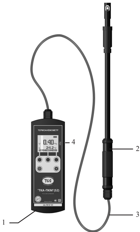
Рис.1. Внешний вид прибора “ТКА-ПКМ”(52).