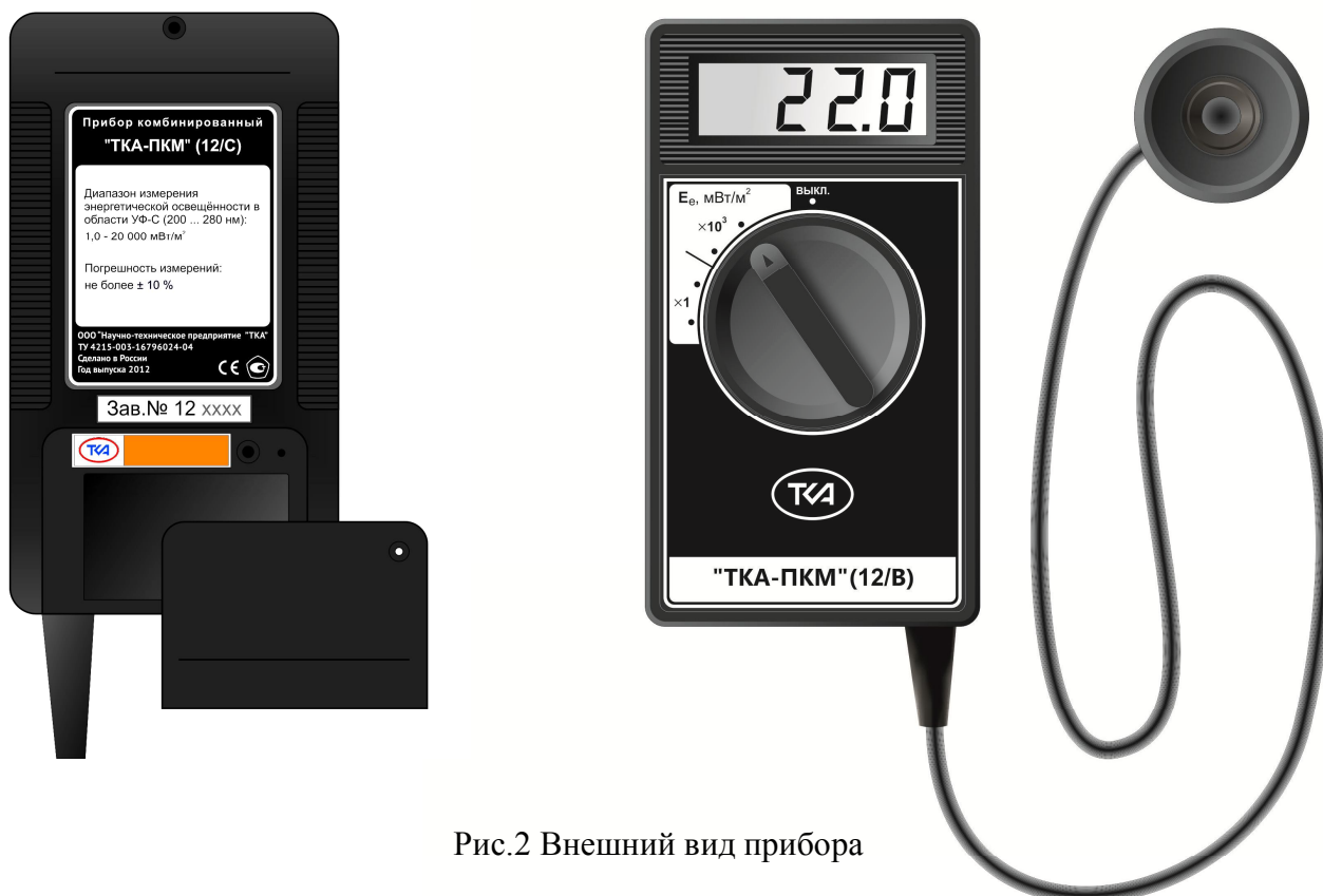
Рис.2 Внешний вид прибора